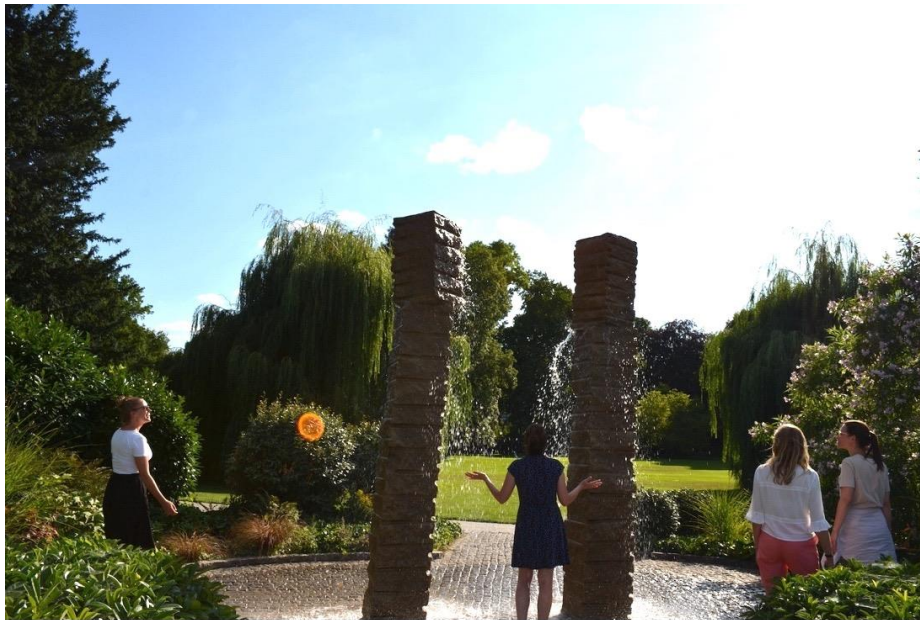
Abbildung 2: Tanzende Steine Luisenpark.