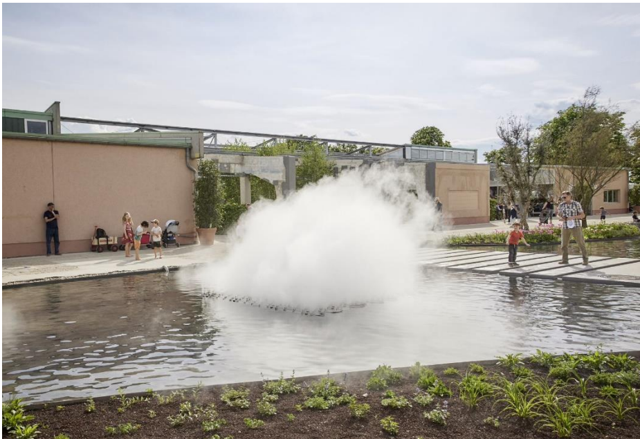
Abbildung 7: Die „CO 2 -Wolke“ auf Spinelli besteht aus einem kalten Wasserdampf