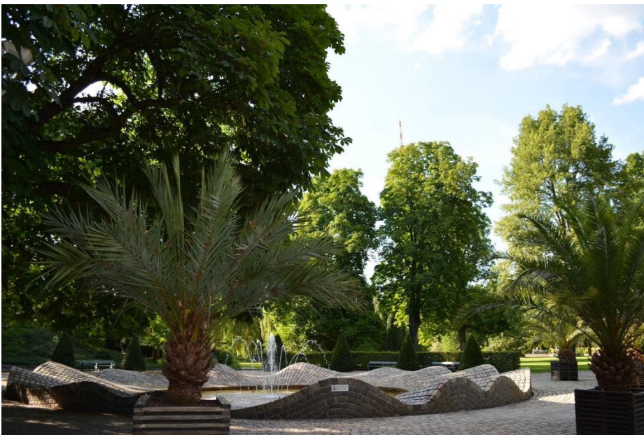
Abbildung 4: Wellenbrunnen