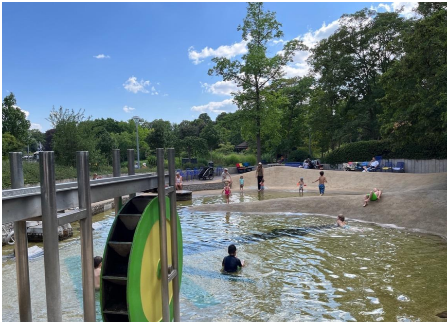
Abbildung 3: Wasserspielplatz – Hotspot für Kids.