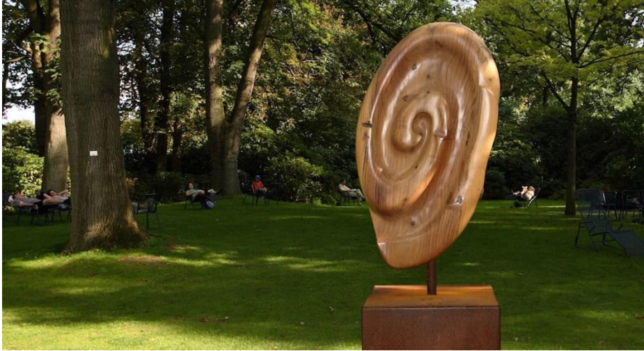
Abbildung 6: KlangOase