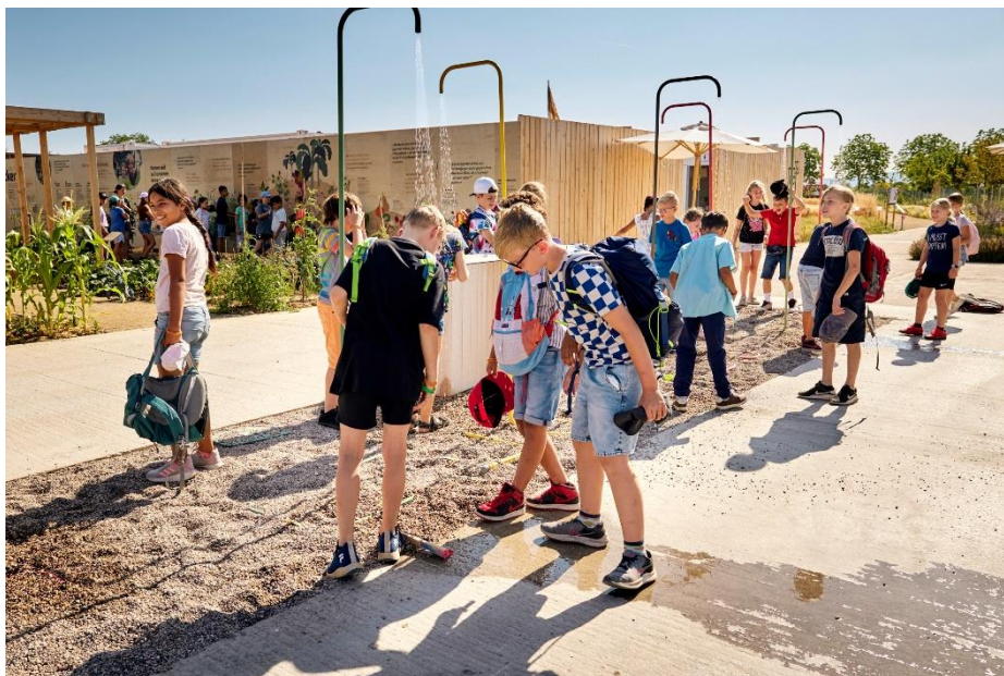
Abbildung 1: Im Spinelli-Park bieten Duschen Erfrischung auf Knopfdruck.

Kids ist derzeit der Wasserspielplatz nahe dem Eingang am Fernmeldeturm. Mit Wasserspiegel auf Kniehöhe für Kleinkinder bestens geeignet und eine entspannte Sache für Eltern. In der Nähe stehen in der KlangOase Liegestühle unter schattenspendenden Bäumen bereit, aus den Baumkronen erklingt Entspannungsmusik. Wasser für alle gibt es außerdem direkt vor der großen Tropenhalle: Die Plastik „Tanzende Steine“ versprüht durchgehend kühles H 2 O. Unweit davon ist es schattig nahe des Wellenbrunnens am Buchsbaum-Wandelgang oder am Gebirgsbach: Fuß- oder Ganzkörperbad erlaubt!