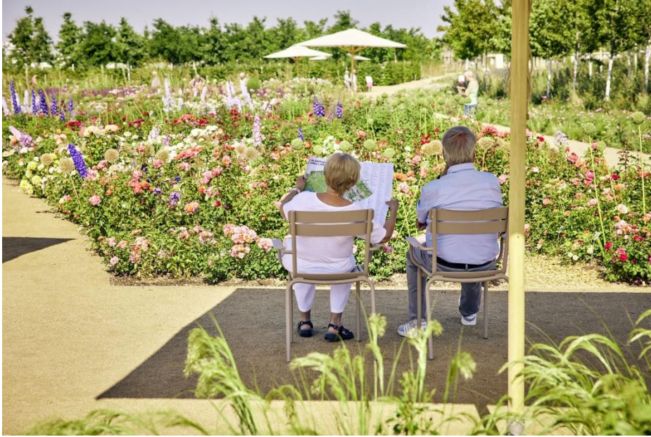
Abbildung 8: Besucher entspannen sich auf schattig gelegenen Sitzplätzen.