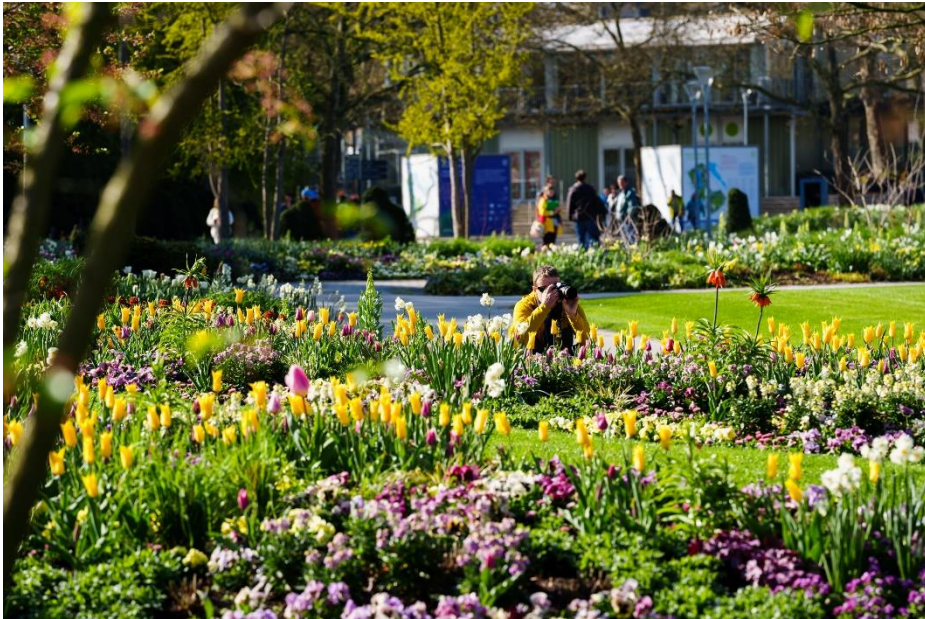
Ein buntes Blumenmeer empfing die Besucher*innen auf der BUGA 23.