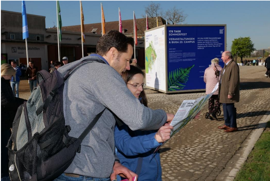
Die ersten Gäste verschafften sich einen Überblick über das Spinelli-Gelände.