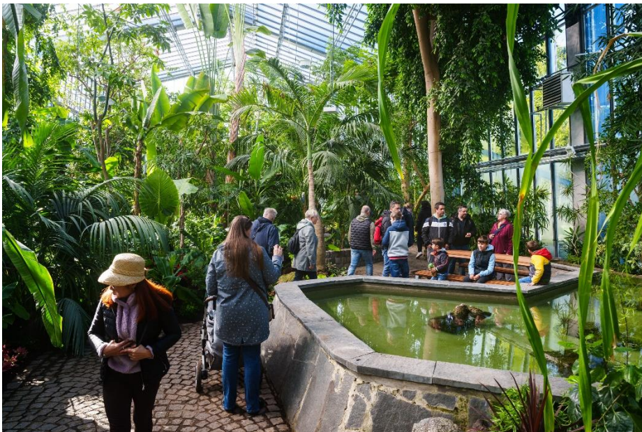
Ein Blick ins Pflanzenschauhaus im Luisenpark.