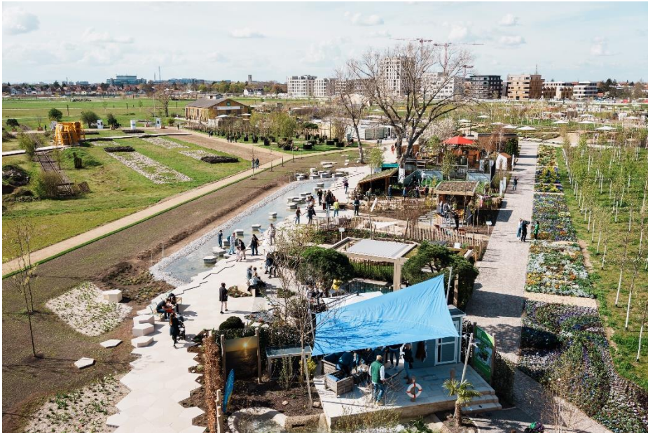
Das Experimentierfeld im Spinelli-Park präsentiert Ausstellungsbeiträge rund um Nachhaltigkeit.