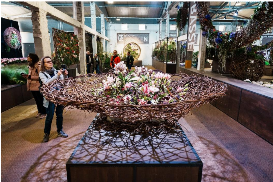
„Uffbasse“ ist eine der 19 Blumenhallenschauen in der U-Halle im Spinelli-Park.