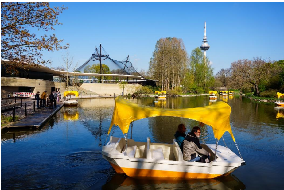
Alt bekannte Attraktion im Luisenpark: Die Gondolettas auf dem Kutzerweiher.