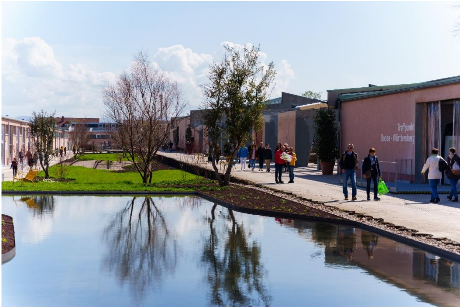
Die U-Halle im Spinelli-Park wurde für die BUGA 23 zurückgebaut und aufgewertet, und bildet jetzt das Herzstück des Geländes.