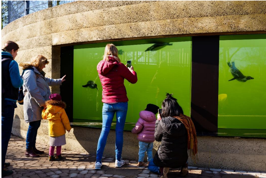
Besuchermagnet im Luisenpark waren die frisch aus dem Ausweichquartier in Frankfurt zurückgekehrten Pinguine.