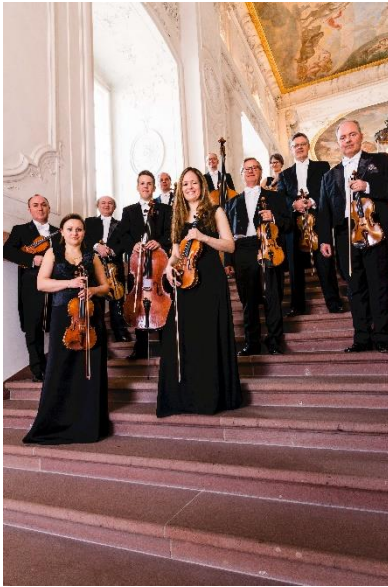
Sorgen für entspannende Momente auf der BUGA 23: Die Traumkonzerte des Kurfürstlichen Kammerorchesters.