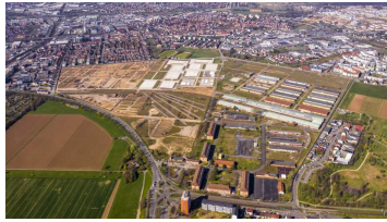
Das Spinelli-Gelände als Luftaufnahme

was hier passiert.“ Ab Sommer sollen die Gestaltung des Geländes und die Anlage von Wegeverbindungen, ausgehend vom westlichen Teil der Fläche, starten. „Wir können dann – gerade in der aktuell schwierigen Zeit – endlich auch Vorfreude unter den Mannheimerinnen und Mannheimern erzeugen für die BUGA 23 als tolles Großereignis in drei Jahren“, so Schnellbach.